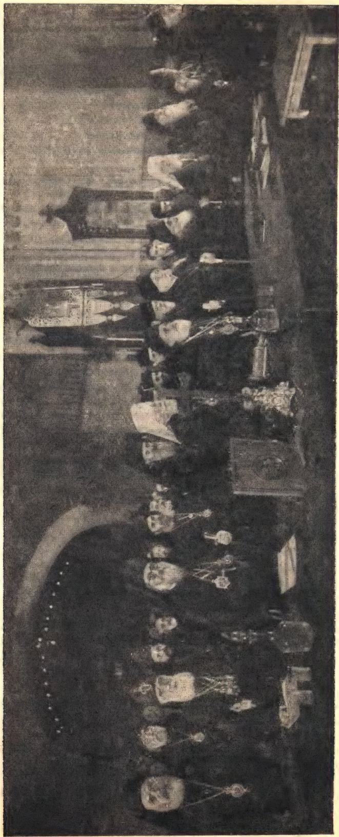
На Поместном Соборе Русской Православной Церкви. Во время молебна перед открытием заседаний Собора.